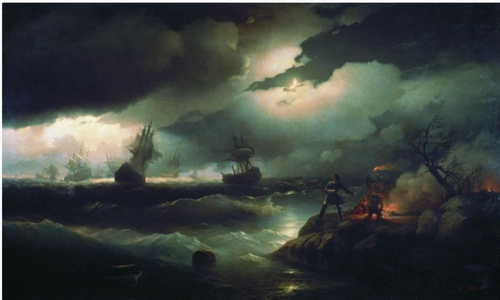
И.К. Айвазовский Петр I при Красной горке, зажигающий костер на берегу для подачи сигнала гибнущим судам своим (1846 г.)