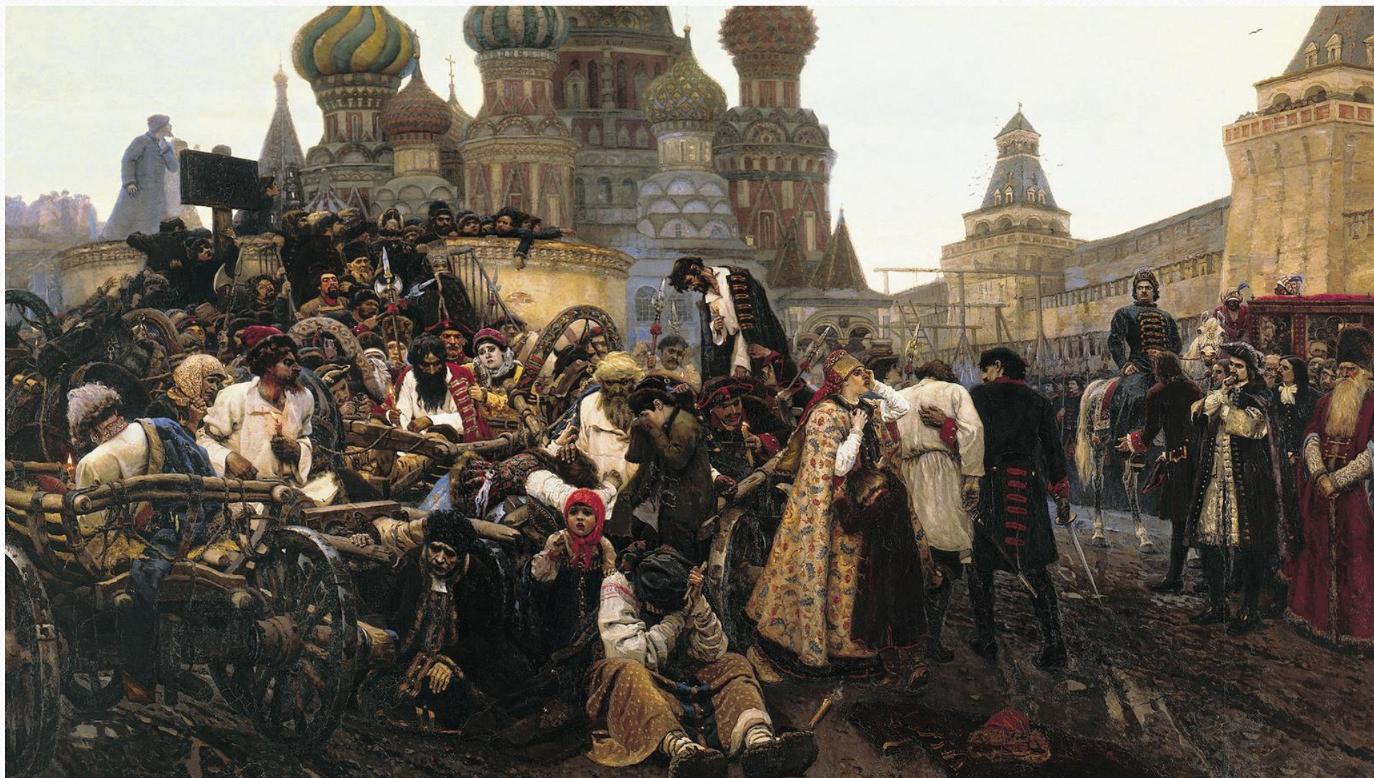
• В.И. Суриков Утро стрелецкой казни (1881 г.)